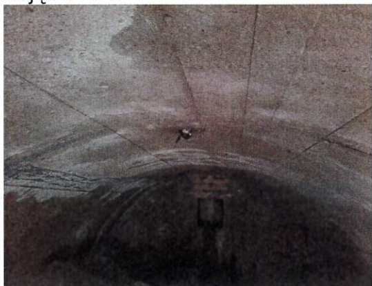
Zdjęcie nr 6