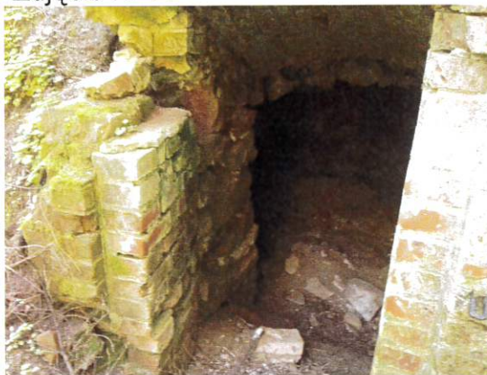
Zdjęcie nr 17