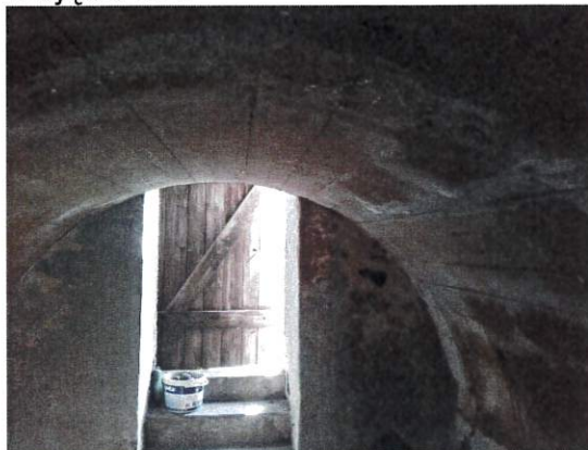
Zdjęcie nr 7