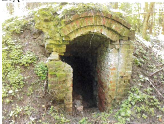
Zdjęcie nr 16