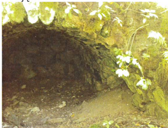
Zdjęcie nr 13