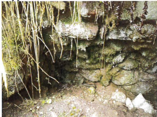
Zdjęcie nr 10