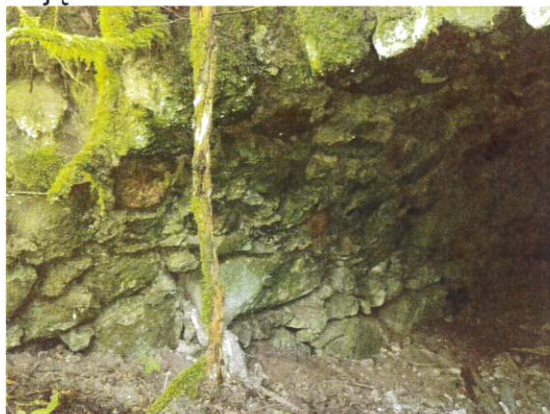
Zdjęcie nr 12