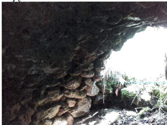
Zdjęcie nr 8