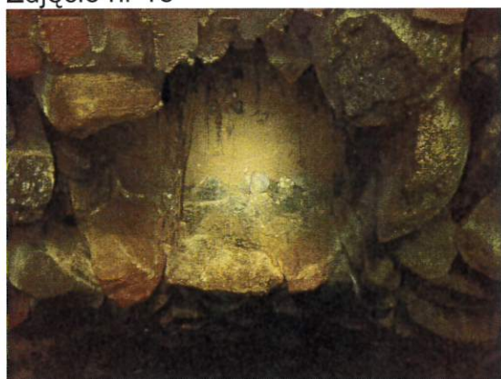
Zdjęcie nr 18